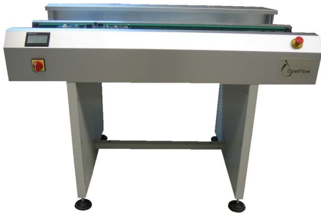
MEDIDAS EN MM