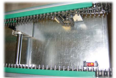
DETALLE CADENA Y AJUSTE DE ANCHO