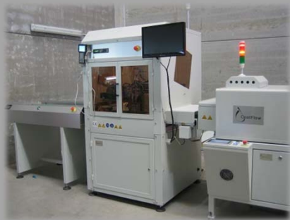
CONVEYOR DE CARGA CFC15 ALIMENTANDO LÍNEA AUTOMÁTICA